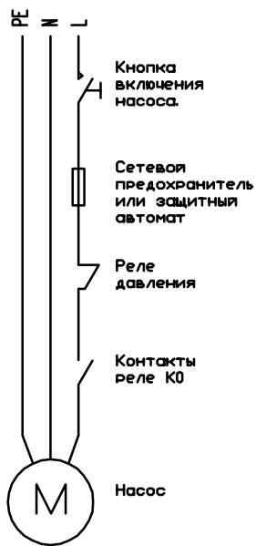
Блок управления "Gidrolock".